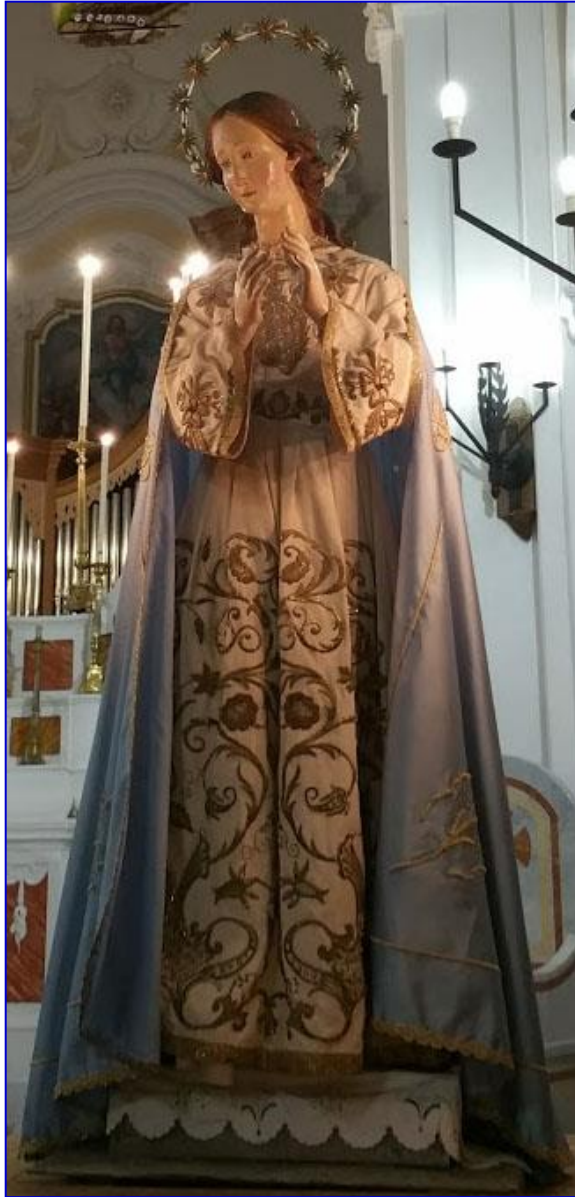
La Madonna del Rosario