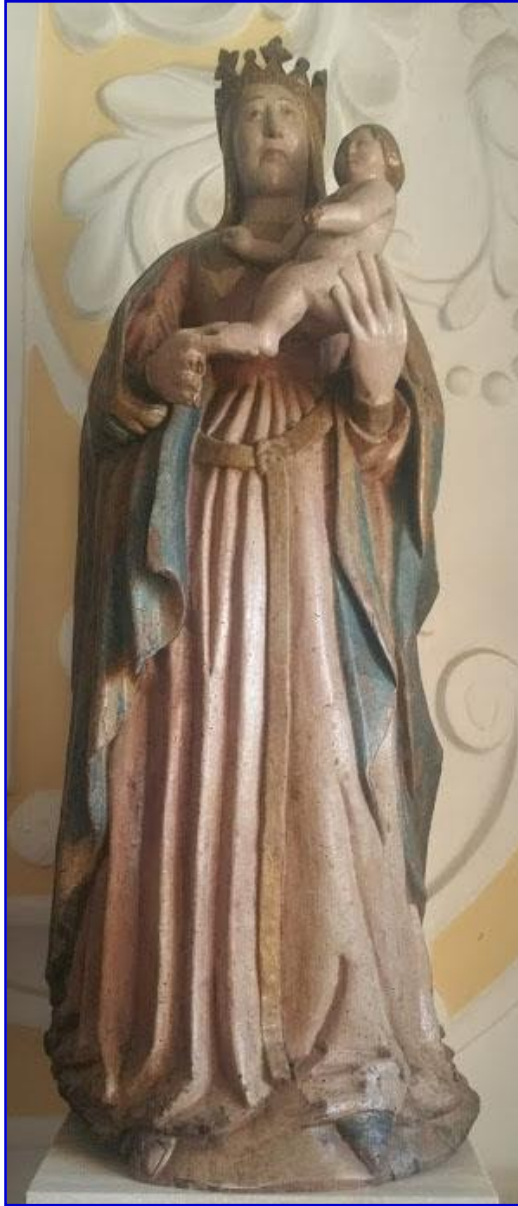
La Madonna della Cindola